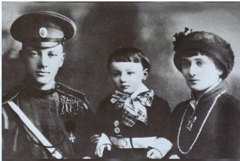
Николай Гумилев и Анна Ахматова с сыном Львом

Пара после венчания решила поселиться в европейской Мекке людей искусства — в Париже. Там у Ахматовой вспыхнул страстный роман с художником Амедео Модильяни. Чтобы сохранить брак, Гумилев настоял на возвращении в Россию. Это произошло в 1911-м. В 1912 году у супругов родился сын Лев Гумилев - будущий ученый и писатель.