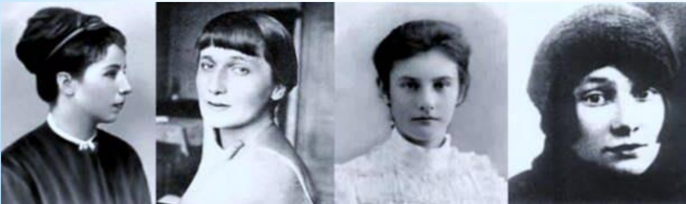
Любимые женщины Николая Гумилева

С Анной Ахматовой - главной женщиной своей жизни - Гумилев познакомился еще во Франции, где во время учебы в Сорбонне он издавал журнал «Сириус», в котором были напечатаны стихи юной Ахматовой. Гумилев делал предложение Анне несколько раз. Она отказывала, томила его, долго молчала и снова писала... В начале 1910 года долгожданное согласие наконец было получено. В апреле того же года они обвенчались.