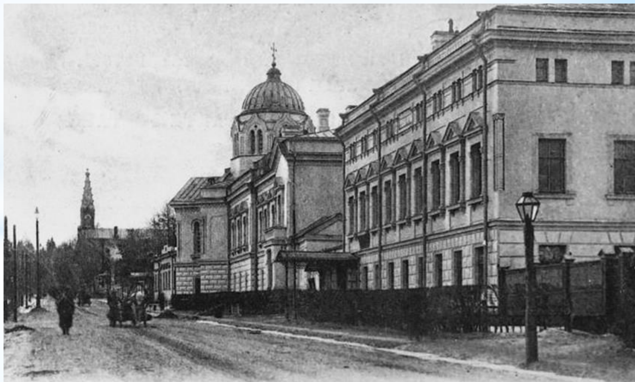
Царскосельская Николаевская мужская гимназия

Хрупкое здоровье юноши давало о себе знать, да и сверстники часто дразнили его за болезненный вид. Поэтому родители приняли решение дать сыну домашнее образование.