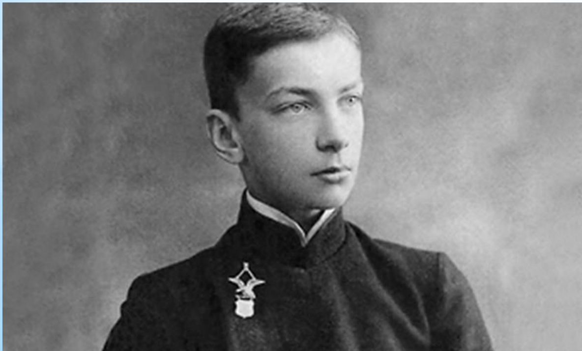
Николай Гумилев принят в 1-ю Тифлисскую мужскую гимназию, 1901 г

В 1900-м заболел туберкулезом Дмитрий, старший брат Николая, и семья на несколько лет отправилась в Тифлис (Тбилиси), чтобы поправить здоровье сыновей. В местной гимназии, где Николай проходил обучение, было напечатано его первое стихотворение.