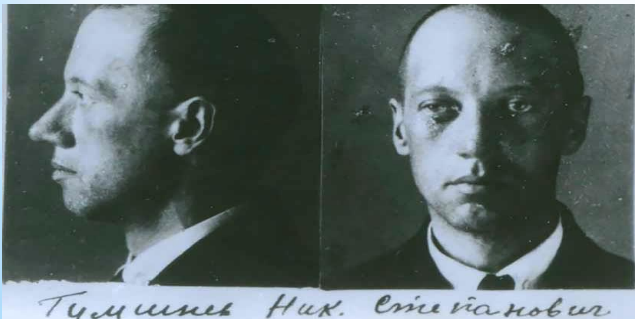
Последняя фотография Н. Гумилева, сделанная в ЧК

Не помогло даже вмешательство влиятельных защитников, в числе которых был и главный пролетарский писатель Горький. Гумилев и еще 56 осужденных были расстреляны в ночь на 26 августа. Место расстрела и захоронения до сих пор остается неизвестным.